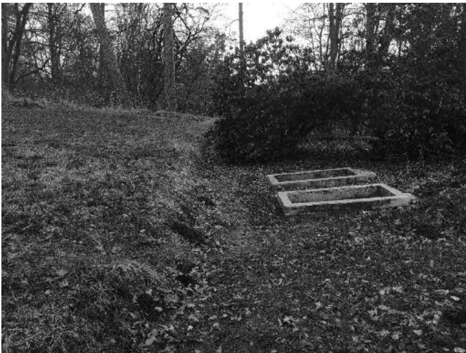
BOV öDE Nr. 15 Küstersteig in Levin

Das unter dem Namen des Bodenordnungsverfahrens Zarnekow eingeordnete Bauvorhaben Küstersteig Levin und Stichstraße vor dem Wohnblock wurde auch in den geförderten Bereich aufgenommen. Die Baumaßnahme erfolgt von der Straße zur Rinderanlage bis hinter die Rechtskurve, in Richtung Upost, einschließlich der ersten Auffahrt zum Gelände der Agrargenossenschaft e.G. Zarnekow.