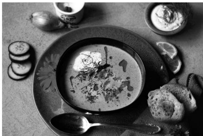
Sommerliche Gurken- Suppe mit Räucherlachs und Zitronen-Crème Fraîche