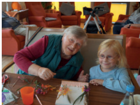
Das gemeinsame Basteln machte Jung und Alt viel Spaß.