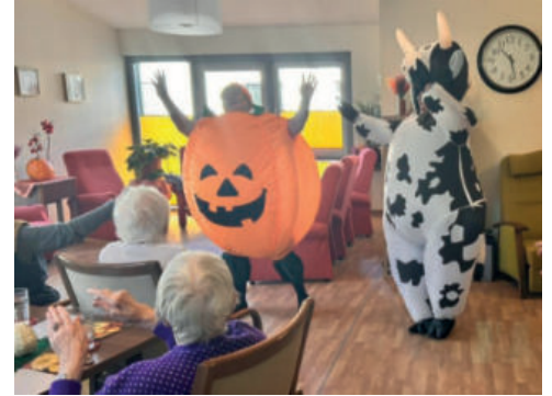
Viel Spaß hatten alle beim Erntedankfest in der DRK-Tagespflege Gnoien.