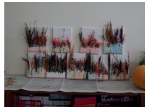
Die Ergebnisse des Herbstbastelns können sich wirklich sehen lassen.