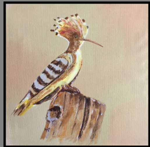
Wiedehopf – Vogel des Jahres 2022

Eine Ausstellung der Malgruppe Teterow Kloster- und Schlossanlage Dargun